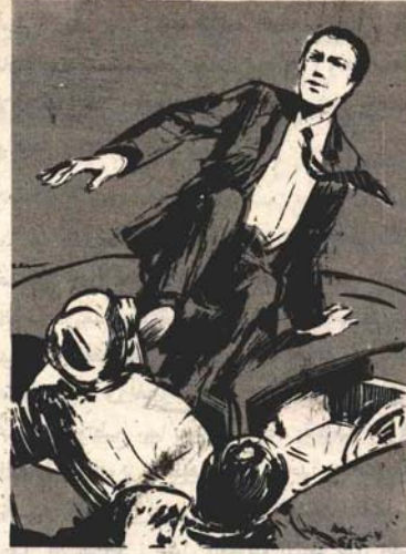
واستد قبضته على ظهر السيارة الزرقاء ، وتحطماها بفقرعة واحدة مذهلة .

— ولكن لماذا ؟.. لقد كنت تمسك بمسدسك ، وكنت قادرًا على الإطاحة بمسدساتهم ببساطة . رفع (أدهم) كتفيه ، وقال ببساطة :