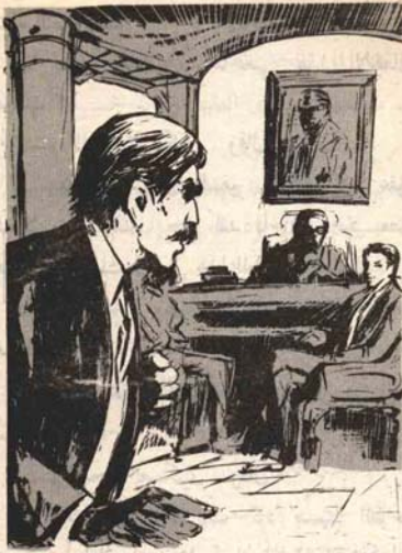
وما أن اجتمع الملحق العسكرى باب العرفة حتى اتسعت عيناه دهشة بشكل مفاجئ وتراجع إلى الخلف .

— بالطبع يا صديقي ، ولكن الملحق الصحفى لنا ما زال تحت الإشراف الطبي نتيجة لإصابته ببعض الجروح من جراء الانفجار .. إنها ليست بالإصابات الخطيرة ، فلم يكن داخل السيارة عند انفجارها ، بل